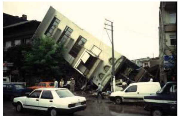
Sismo de Kocaeli, 1999-08-17, Turquia