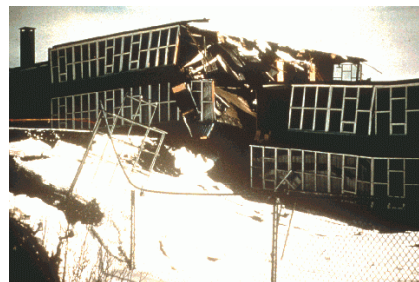
Sismo de Prince William Sound, 1964-03-28, Alasca, EUA