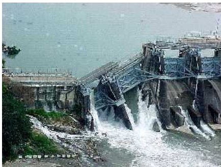
sismo de Ji-Ji 1999-09-20 Taiwan