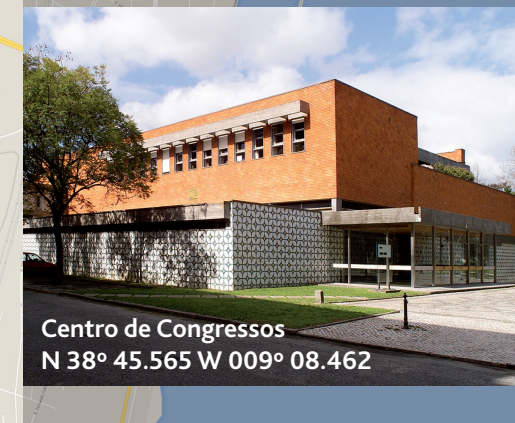
Centro de Congressos N 38° 45.565 W 009° 08.462