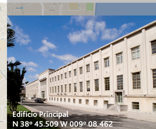
Edifício Principal N 38° 45.509 W 009° 08.462